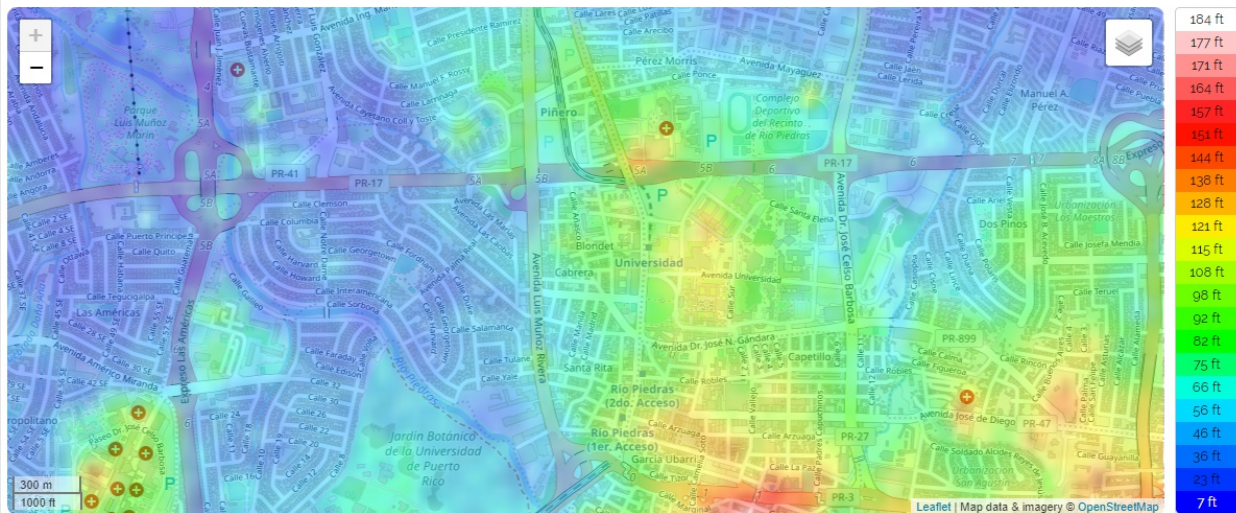
Río Piedras, San Juan, Puerto Rico, 00925, United States of America (18.39805 -66.05240)

REFERENCIA: https://en-ie.topographic-map.com/maps/eki7/R%C3%ADo-Piedras/